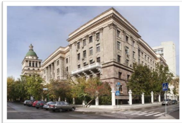
СХЕМА ПРОЕЗДА: Москва, пер. Сивцев Вражек, д. 26/28 Поликлиника №1 Управления делами президента РФ (вход через проходную с Калошина пер., д.3, стр.2), конференц-зал.

Проезд до ст. метро Смоленская, Кропоткинская